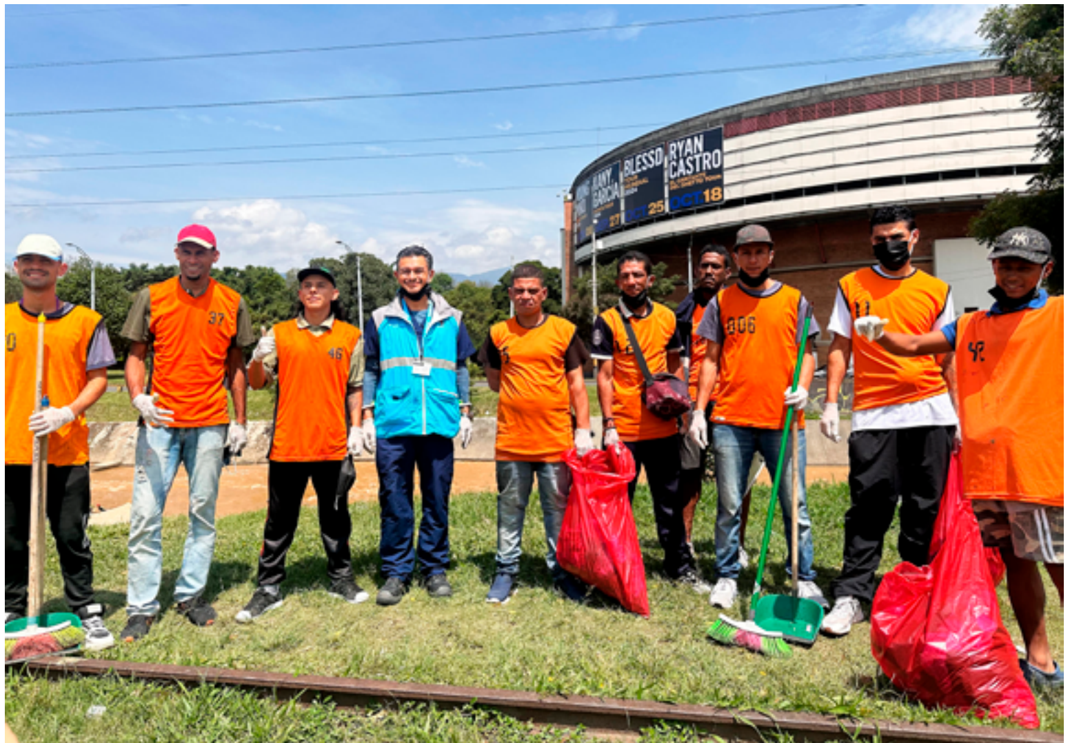
Este grupo de habitantes de calle en proceso de recuperación, trabajan a diario en distintas labores para embellecer el centro de Medellín.

“Estos procesos, como las jornadas de aseo y ornato, nos permiten ir identificando quienes están más listos para esa