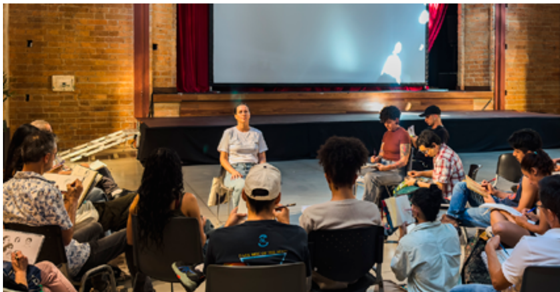
Quienes asisten provienen de distintas disciplinas del conocimiento, que se reúnen para dejar que sus trazos fluyan libremente

constantes de “Viernes de Retratos,” es un rostro habitual cada semana. Ha plasmado innumerables rostros que no solo capturan expresiones, sino también historias. Sus dibujos, coleccionados en libretas, han trascendido fronteras.